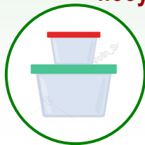
іграшки, контейнери для їжі