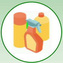
кришки, пляшки від побутової хімії